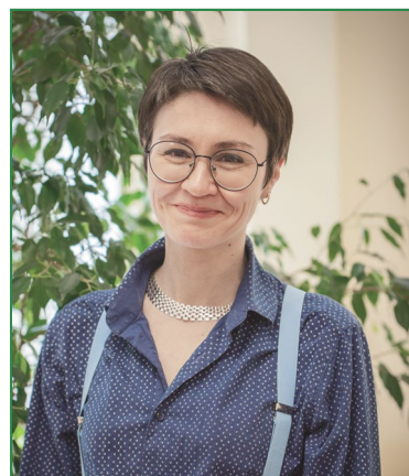
Молодежный центр наукограда на пороге открытия