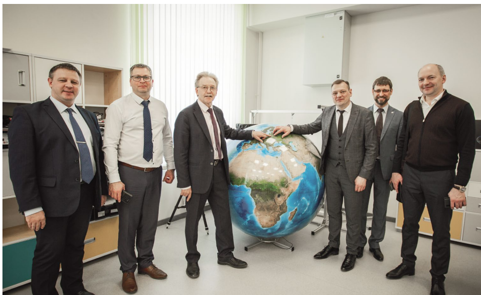
Наукоград Кольцово посетила делегация Могилевской области ▶ 8