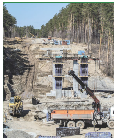
Возведение фундамента эстакады практически завершено